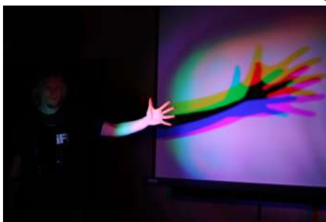
Série přednášek ze světa fyziky