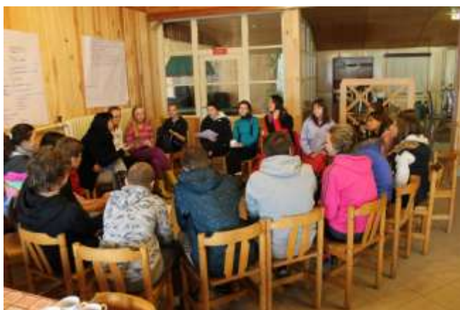
Deštivý pobyt v přírodě na Brdech