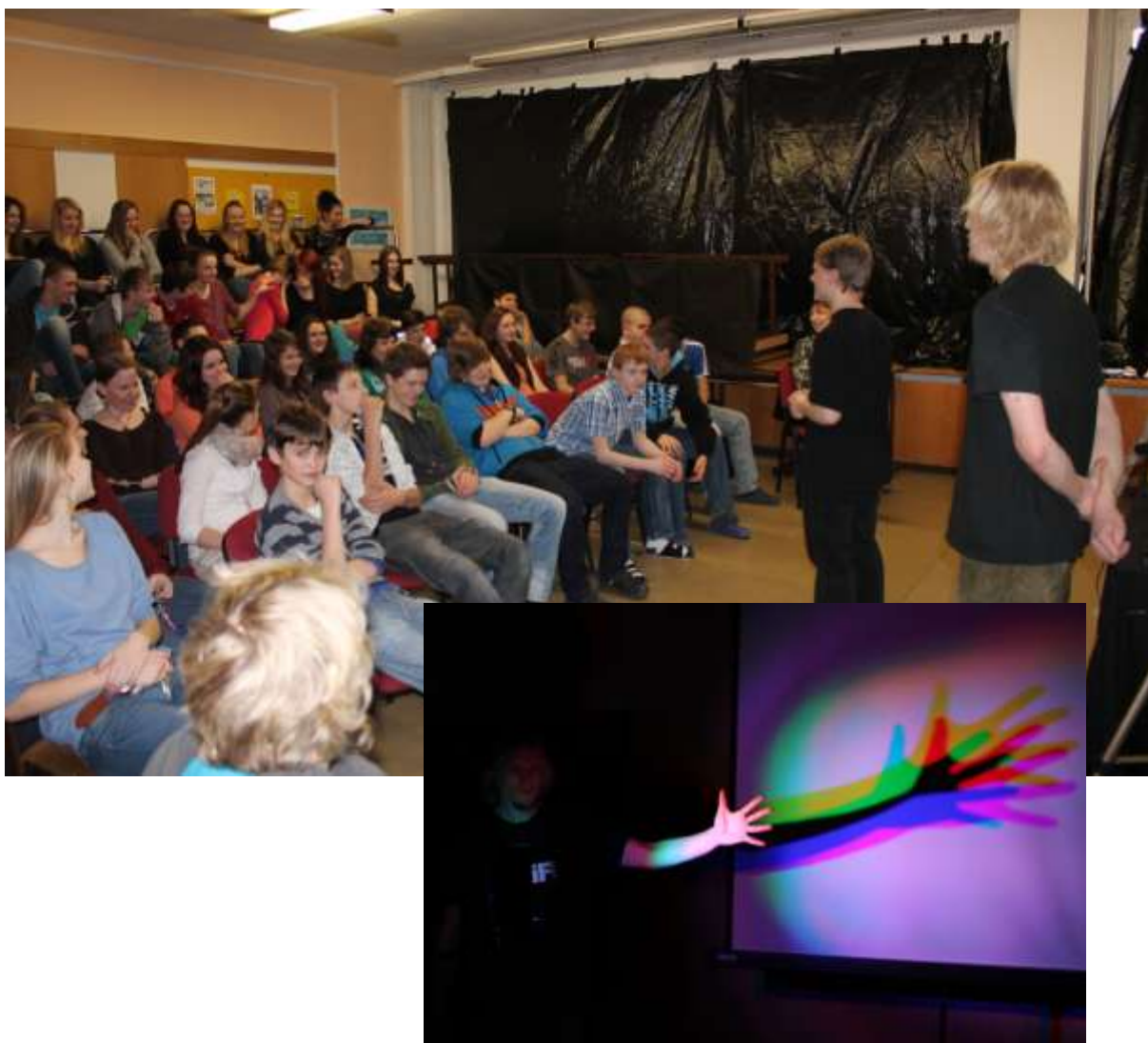
Úžasné divadlo fyziky - prednáška