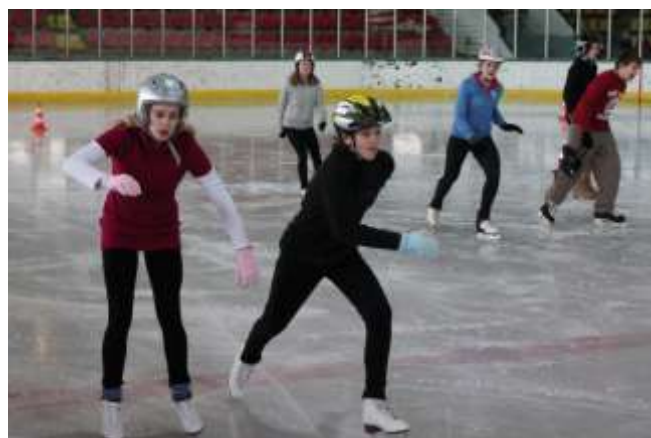
Závody v rychlobruslení