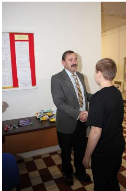
Předání ceny – soutěž v píšQworkách