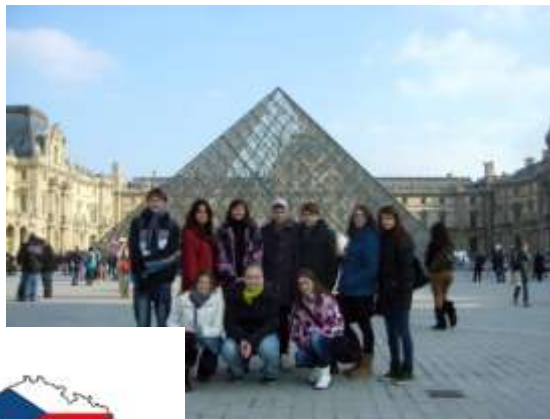
S Comeniem v Paříži