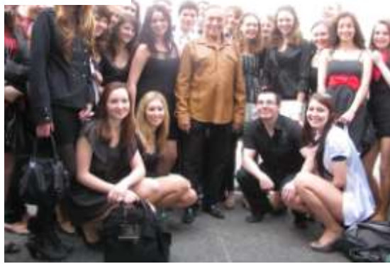
V pořadu ČT s Karlem Gottem