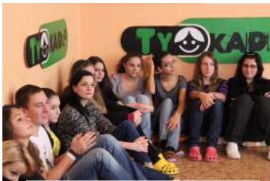
V televizním pořadu Tykadlo