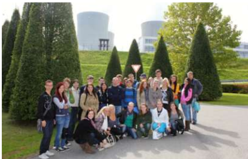
Exkurze v Temelíně