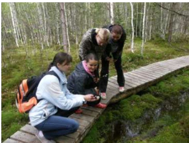
Biologicko-ekologický kurz na naučné stezce