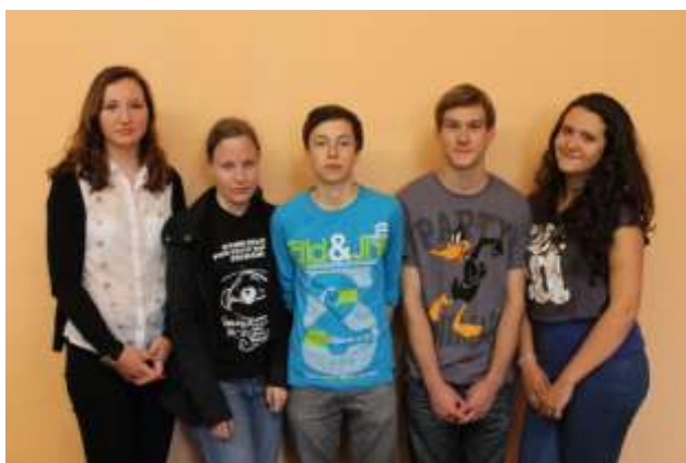
Nejlepší ve finanční gramotnosti