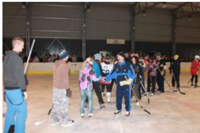
Předvánoční hokejové utkání žáků a učitelů