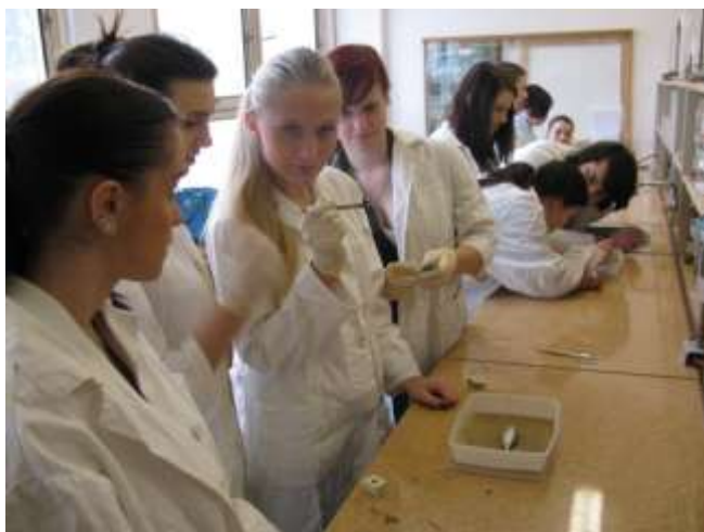
V chemické laboratoři