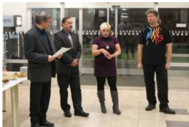
Z vernisáže výtvarných prací žáků školy v Oblastní nemocnici Příbram