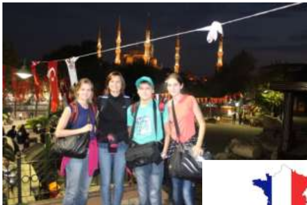
S Comeniem v Istanbulu