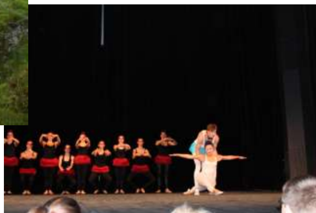
Den divadla 2013 – Z díla Karla Čapka