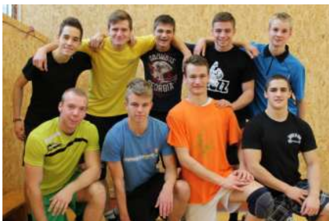
Školní družstvo ve florbalu