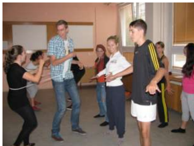
Ze semináře improvizace