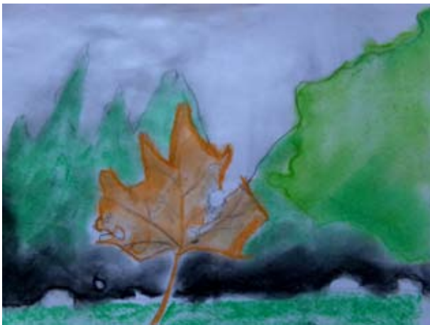
Ondřej Pekárek, 1. A