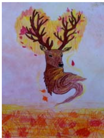
Šárka Kameníková, 4. A