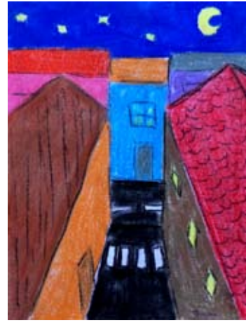
Eliška Brandová, 4. A