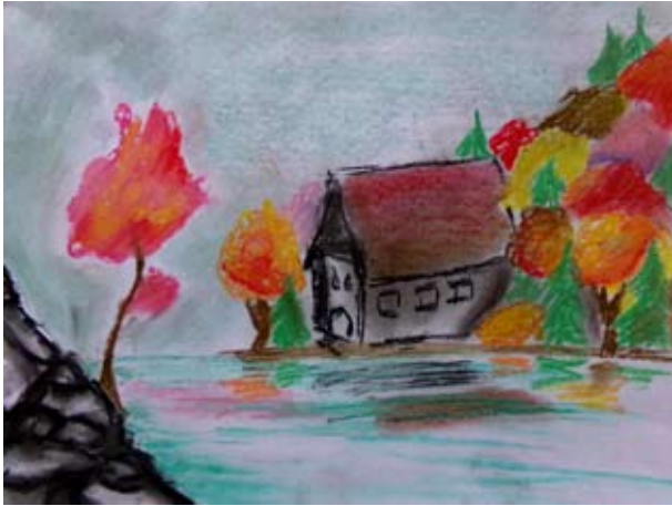
Tereza Jánová, 2. C